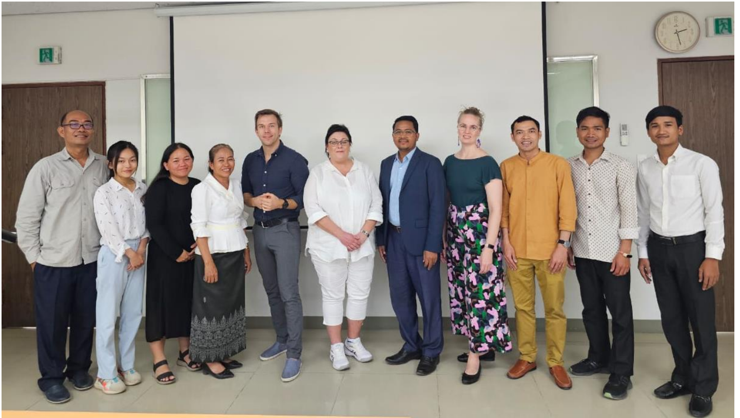
Những ngày đào tạo WP2 tại Campuchia, tháng 1 năm 2024

Nội dung chính của gói công việc WP2 liên quan đến việc lập kế hoạch toàn diện để xử lý, chuyển giao và lưu trữ dữ liệu theo quy chuẩn đạo đức. Phương pháp nhóm tập trung bao gồm việc phát triển quy trình phỏng vấn, danh sách kiểm tra và câu hỏi phỏng vấn nhóm tập trung hiệu quả, giải quyết thách thức và đề xuất giải pháp. Phân tích dữ liệu được thực hiện thông qua phân tích theo chủ đề, với các bản dịch cần thiết, để củng cố sự hiểu biết.