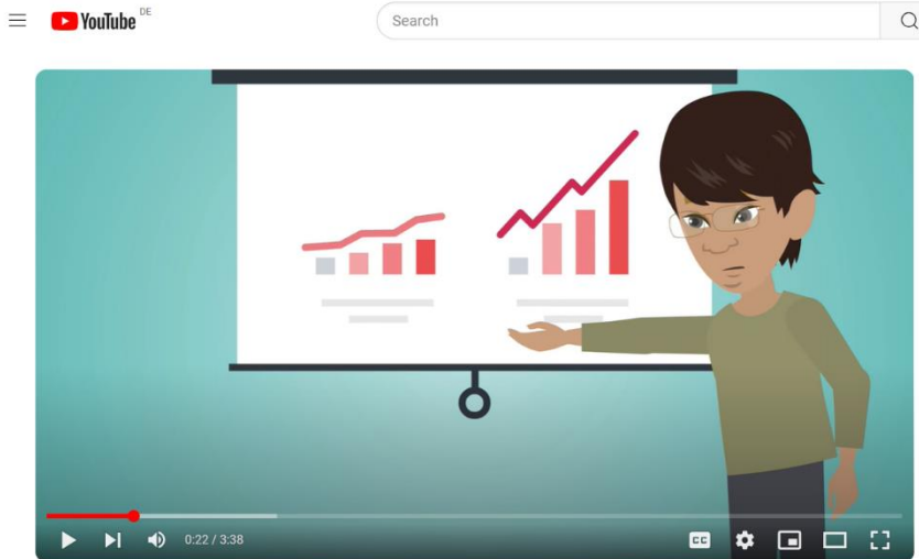
Welcome_Module 0 Unlisted

Đây là chương trình mà người dùng sẽ tự mình trải nghiệm, tương tác đa phương tiện và được cung cấp qua internet. Chương trình bao gồm 8 mô-đun được định hướng để học và thực hành các chiến lược tâm lý khác nhau. Chương trình được phát triển bởi Labpsitec, Đại học Jaume I, và đã được xác nhận sử dụng cho nhiều nhóm đối tượng khác nhau.