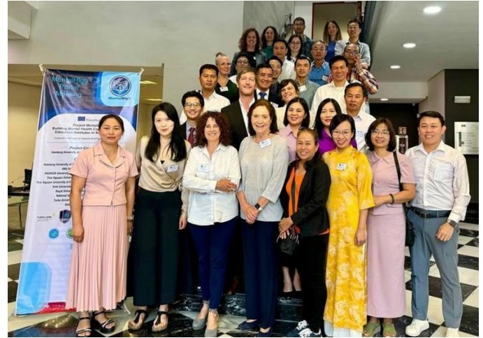
Thành viên dự án MentalHigh tại Valencia, tháng 6.2024

Các bài trình bày đã làm rõ tiến độ của từng gói công việc. Các nội dung thảo luận bao gồm các công bố khoa học trong tương lai, các phân tích kết quả cuộc phỏng vấn nhóm tập trung cũng như sự phát triển của can thiệp kỹ thuật số như 'Khóa học MoodCare và Shining mind'.