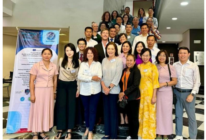
MentalHigh Consortium នៅ Valencia, ខែមិថុនា 2024

ចាប់ពីថ្ងៃទី 27 ដល់ថ្ងៃទី 31 ខែឧសភា ឆ្នាំ 2024 កិច្ចប្រជុំ MentalHigh Consortium ត្រូវបានធ្វើឡើងនៅសាកលវិទ្យាល័យ Fundació Universitat Empresa (ADEIT) នៅកណ្តាលទីក្រុង Valencia ប្រទេសអេស្ប៉ាញ។ កិច្ចប្រជុំនេះមានការចូលរួមពីតំណាងនៃសាកលវិទ្យាល័យទាំងអស់ដែលជាដៃគូនៃគម្រោង MentalHigh ដូចជា HAW, VNU, TUEBA, VUTED, NIE, RUPP, TUAU, VNU USSH, TURKU AMK និង UJI ។